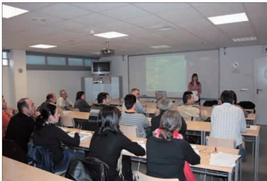
ASISTENTES al curso.

Las empresas que realizaron el curso disponen ya de los documentos e información necesarios para tener cubiertas estas obligaciones, además de contar con un asesoramiento telefónico posterior.