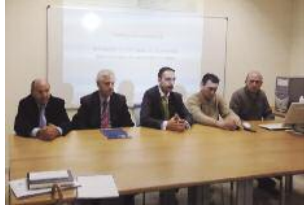
NO VIRTUAL. Los directivos de FREMM e Industria, junto al Metal de Yecla.

Esta gestión constituye el principio de los trabajos de la Dirección General para avanzar en este sugesti-