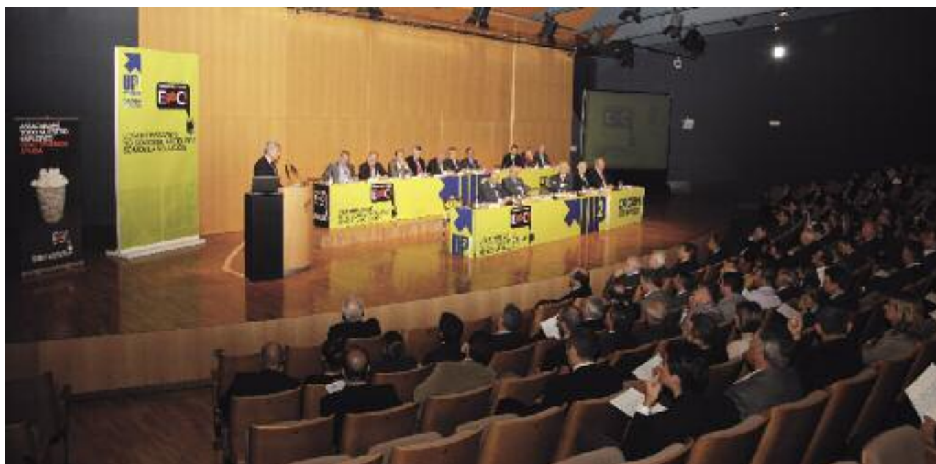
ÉXITO. Cientos de empresarios participaron en el acto.

“Hay que modernizar con innovación, no con bajos salarios”