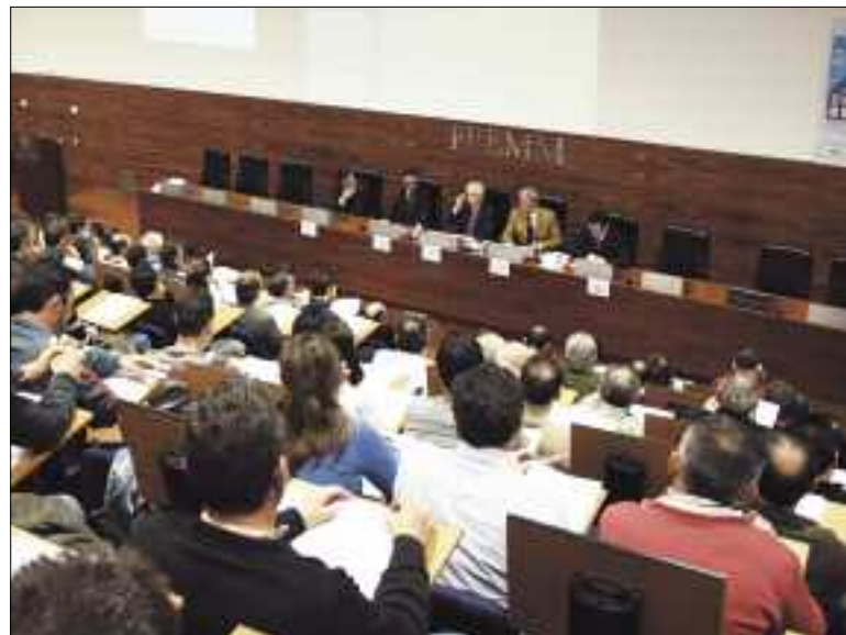
DE INTERÉS EN FREMM.

Respecto al Plan Renove la junta directiva del Gremio Regional de Fachadas Ligeras y Cerrajería trabajó a finales de año en la elaboración de un borrador, que se presentó a la agencia regional de la energía el 14 de enero, y se ha mantenido contacto tanto con la Asociación Nacional ASEFABE como con ARGEM para impulsar el lanzamiento de estas ayudas.