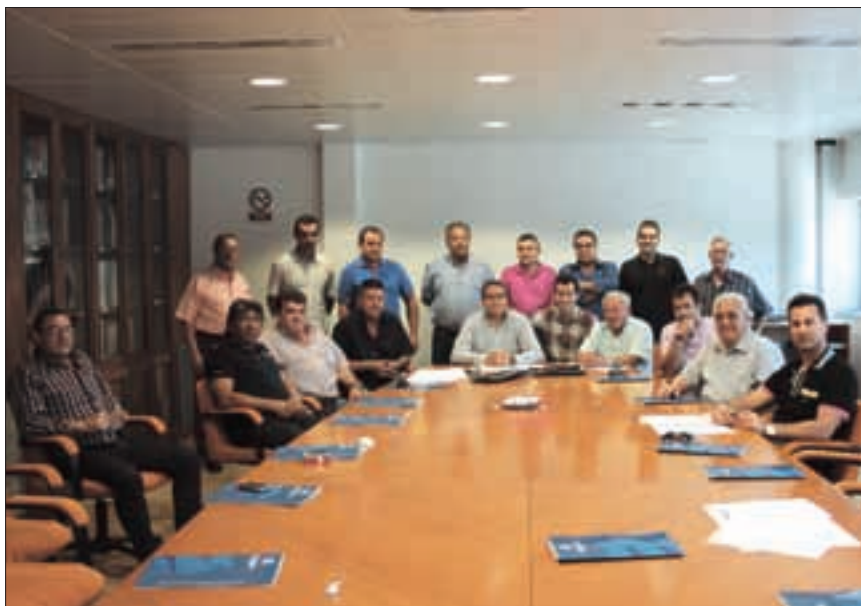
UNIDAD. Los empresarios de Desguaces y CARD llaman a unir esfuerzos para defender los intereses del sector.