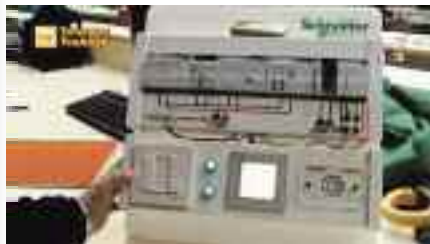
Curso de Electricidad