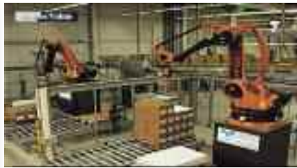
Curso de Robótica