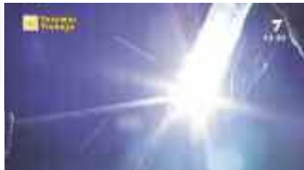
Curso de Soldador