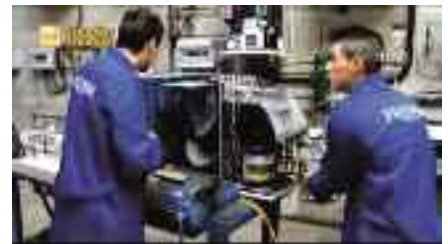
Curso de Frigorista Industrial