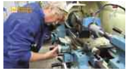
Curso de Tornero-Fresador