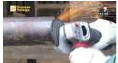
Curso de Carpintería Metálica