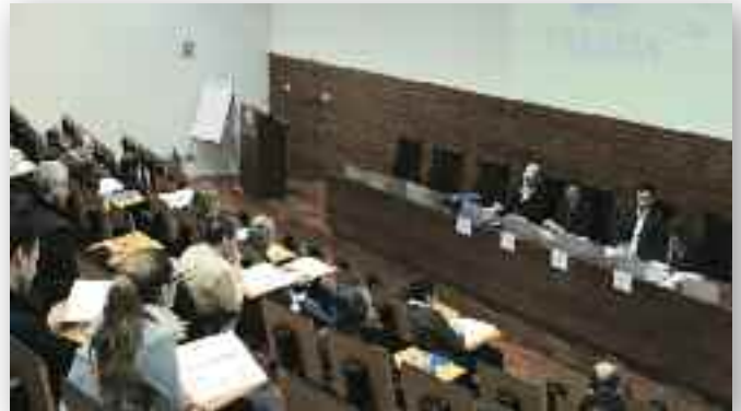
INTERESANTE. Aspecto de la jornada promovida por el Circulo de Jóvenes del Metal.

A base de “clics” en su ordenador, podrá optar a las licitaciones públicas que promueven las diferentes administraciones.